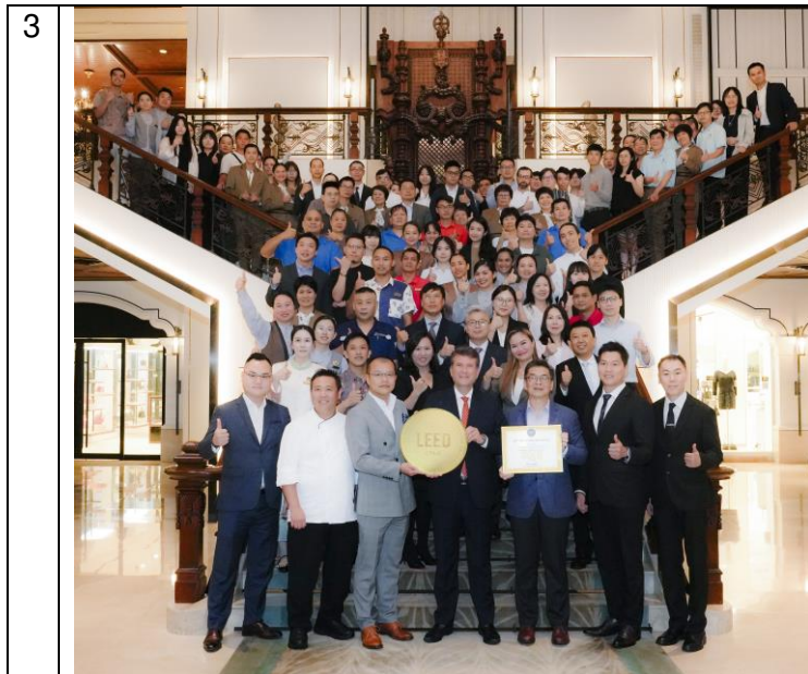
澳門雅辰酒店團隊共賀榮獲 LEED 金獎認證殊榮大合照